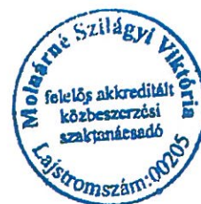
Molnárné Szilágyi Viktória felelős akkreditált közbeszerzési szaktanácsadó